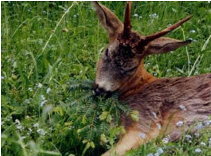
Letzter Bissen- Bruch