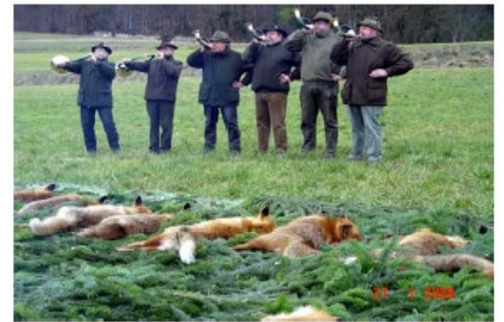
Verblasen der Strecke